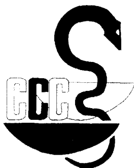
Ryc. 1. Oficjalne logo konferencji.

APS i FMG są organizacjami skupiającymi lekarzy – tzw. police surgeons. Określenie to nie ma bezpośredniego odpowiednika w języku polskim. Są to lekarze różnych specjalności, zazwyczaj lekarze domowi (general practitioners) zajmujący się dodatkowo kliniczną medycyną sądową, czyli najogólniej rzecz biorąc, zastosowaniem wiedzy lekarskiej w postępowaniu karno-sądowym z wy-