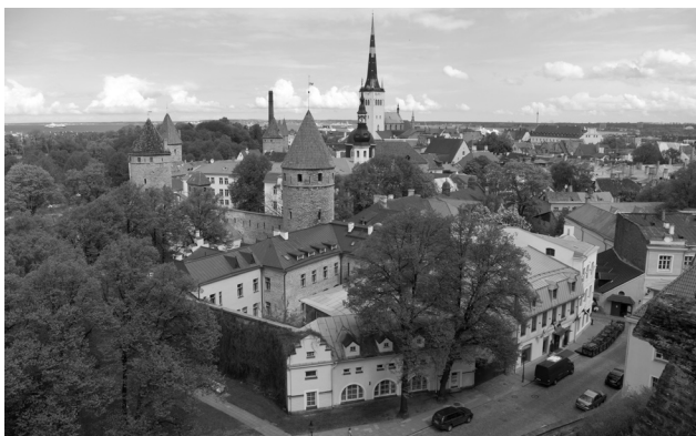
Rys. 1. Centrum Tallina.

Na Konferencji przedstawiono prace w formie 26 referatów, w tym 3 referaty plenarne, wygłoszone przez zaproszonych gości zagranicznych. Na sesji plakatowej przedstawiono 12 posterów. Wśród referatów plenarnych wyróżniał się przedstawiony przez Waney Squier z Department of Neuropathology, West Wing, John Radcliff Hospital (Oxford, Wielka Brytania) – zwracający uwagę na konieczność bardzo ostrożnego traktowania stwierdzanych u niemowląt wybroczyn do siatkówki, czy niewielkich wycieków krwi pod oponę twardą mózgu przy opiniowaniu na temat celowo spowodowanego urazu głowy i zespołu dziecka potrząsanego [1].