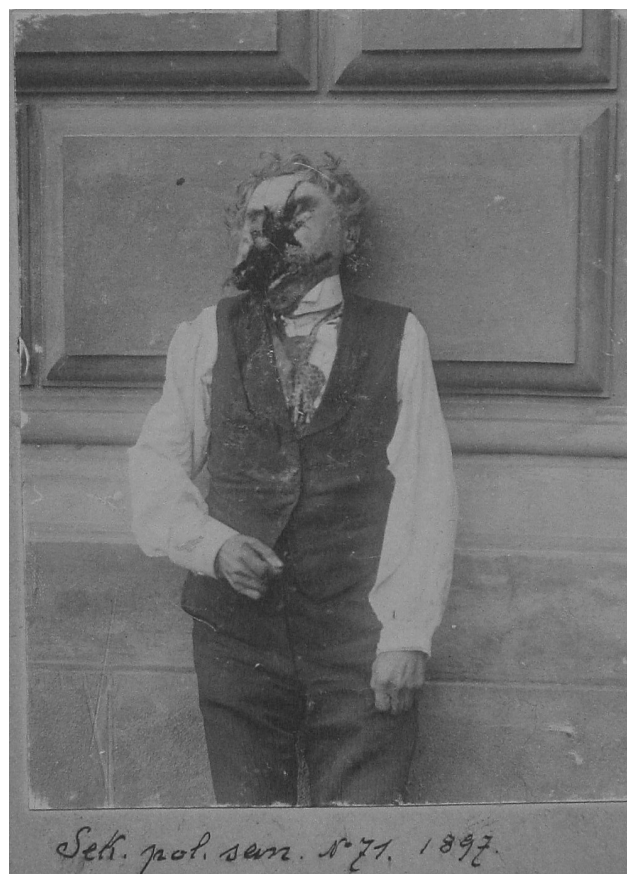
Fig. 2. A photograph of a corpse from 1897, with injury caused by „watery shot”, according to autopsy report.

Kuehne, wykonał eksperyment, w którym zabił królika po umocowaniu jego głowy tak, aby mógł patrzeć tylko na kwaterę okna. Siatkówka oka królika została utrwalona 4% roztworem alunu, a po wysuszeniu miał być na niej widoczny właśnie obraz kwatery okna. Podobne eksperymenty, rzekomo udane, przeprowadził lekarz paryski Vernois w 1906 roku, a samą teorię propagował wiedeński kryminalistyk Haber, jeszcze w 1918 roku. Wachholz już w 1923 roku wykazał absurdalność tego pomysłu, nie wnikając nawet w chemiczne podstawy eksperymentów. Pomysł zapłodnił jednak literatów, i w 1897 roku Jules Claretierre napisał powieść „Oskarżyciel”, w której komisarz policji po wywołaniu optogramu z oka zamordowanego mężczyzny, uzyskał obraz twarzy jego przyjaciela, którego natychmiast aresztowano. Po jakimś czasie komisarz zobaczył portret aresztowanego go wiszący w sklepie, ustalono, że obraz został